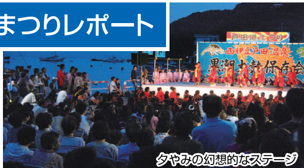
夕やみの幻想的なステージ