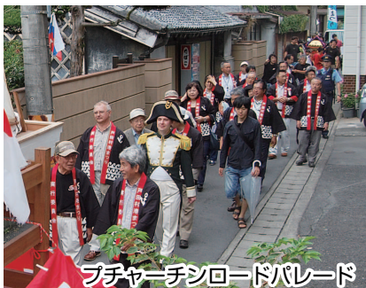
フチャーチンロードパレード