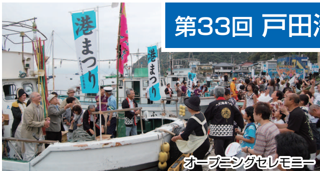
オープニングセレモニー