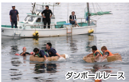
ダンボールレース