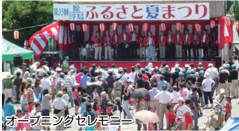
オープニングセレモニー